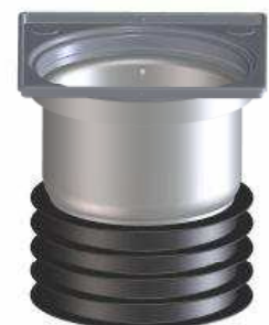
Tijelo odvoda (PP) s višestrukim brtvama za umetanje u cijevi DN 110