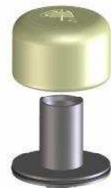
Sifonski umetak (PP-ABS)