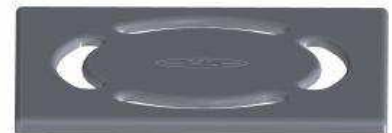
INOX rešetka (V2A)

Podrumi obiteljskih domova se veoma često naknadno dovršavaju. U tim situacijama vodoinstalater priprema cijev DN110 za naknadnu ugradnju slivnika. Upravo u ovim situacijama, HL73Pr je idealan za ugradnju. Jednostavno se umetne u cijev (ne u glavu) i prilagodi visini podne obloge.